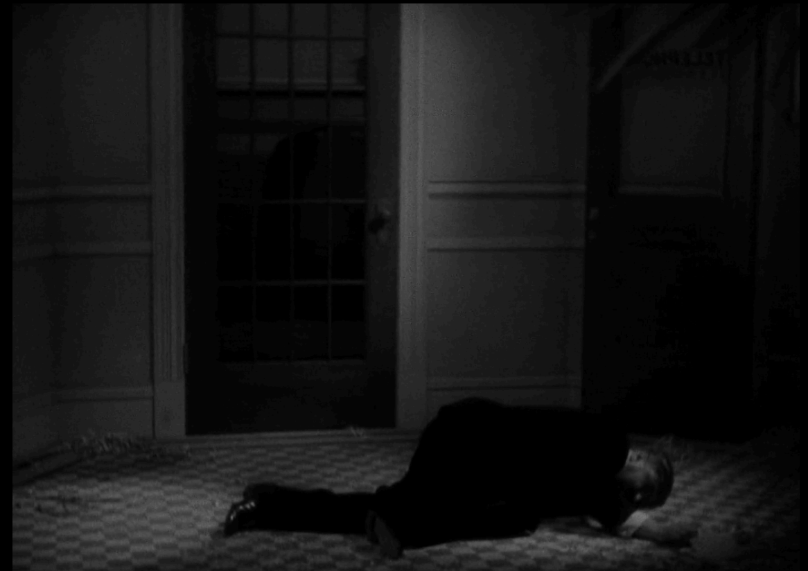
Scarface (Howard Hawks, 1932)