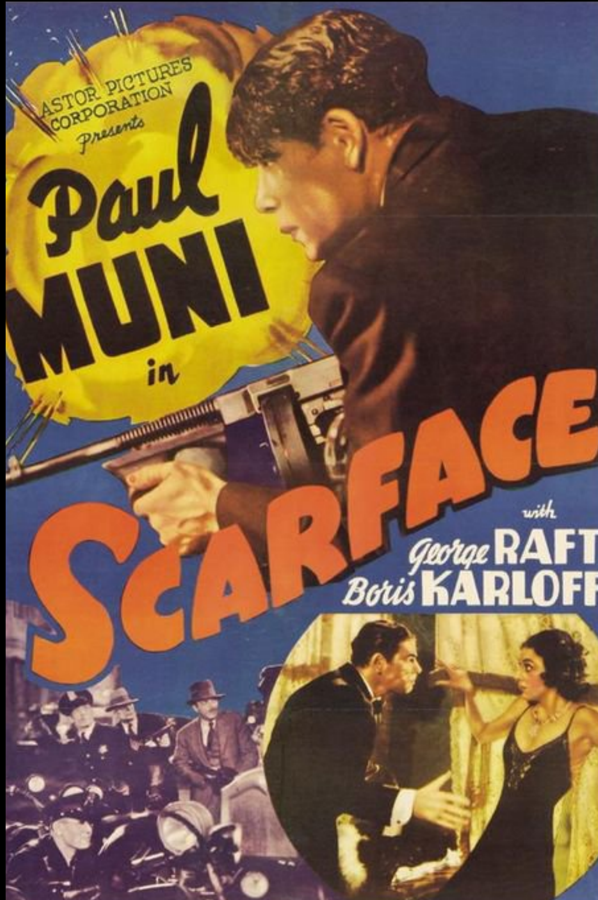
Howard Hawks, 1932 (produit par Howard Hughes)