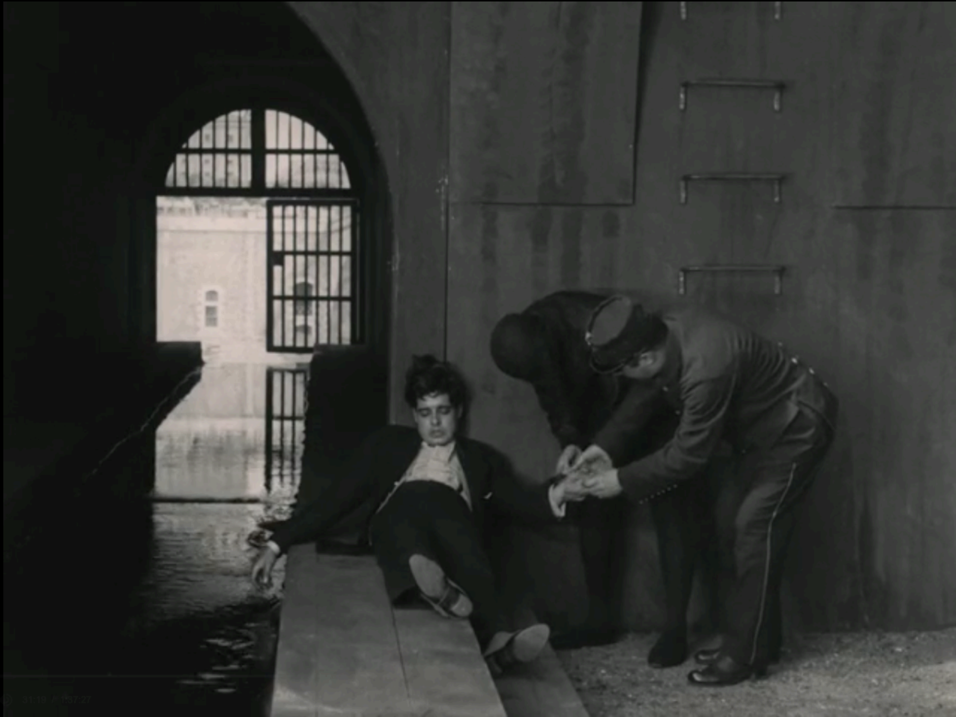
Fantômas , épisode 3 : « Le Mort qui tue » (Louis Feuillade, 1913)