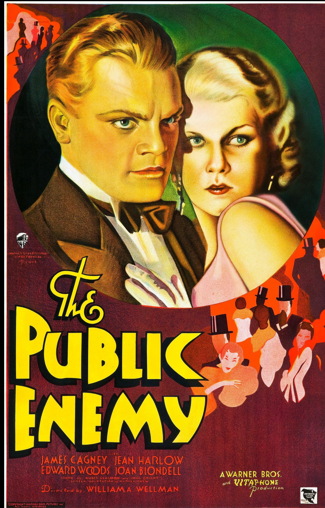
William A. Wellman, 1931