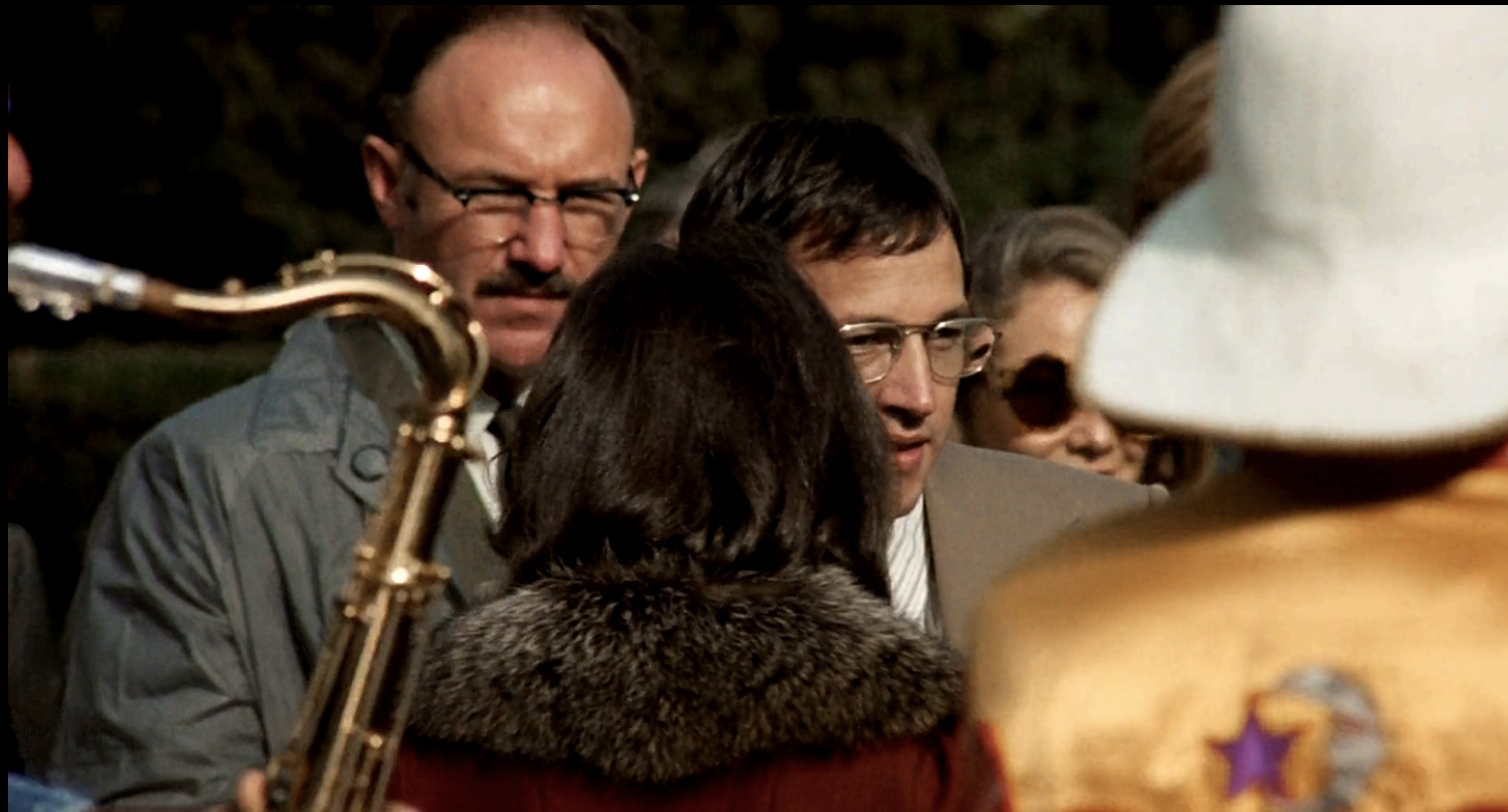
The Conversation (Francis Ford Coppola, 1974)