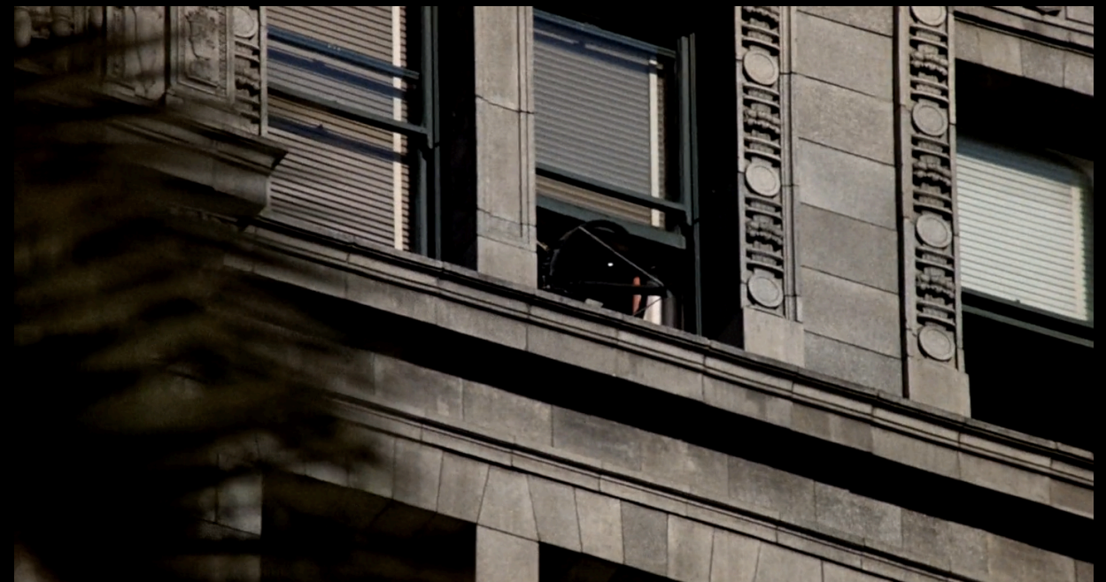
The Conversation (Francis Ford Coppola, 1974)