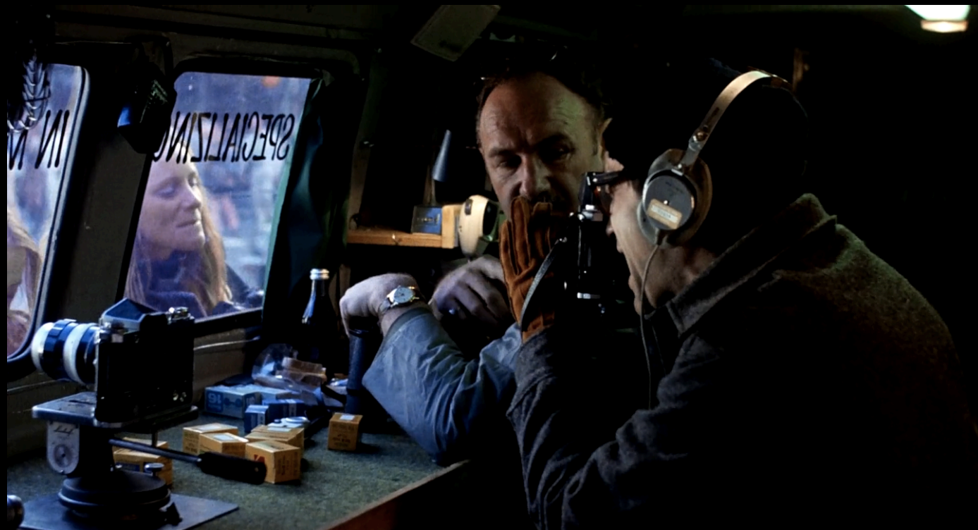
The Conversation (Francis Ford Coppola, 1974)