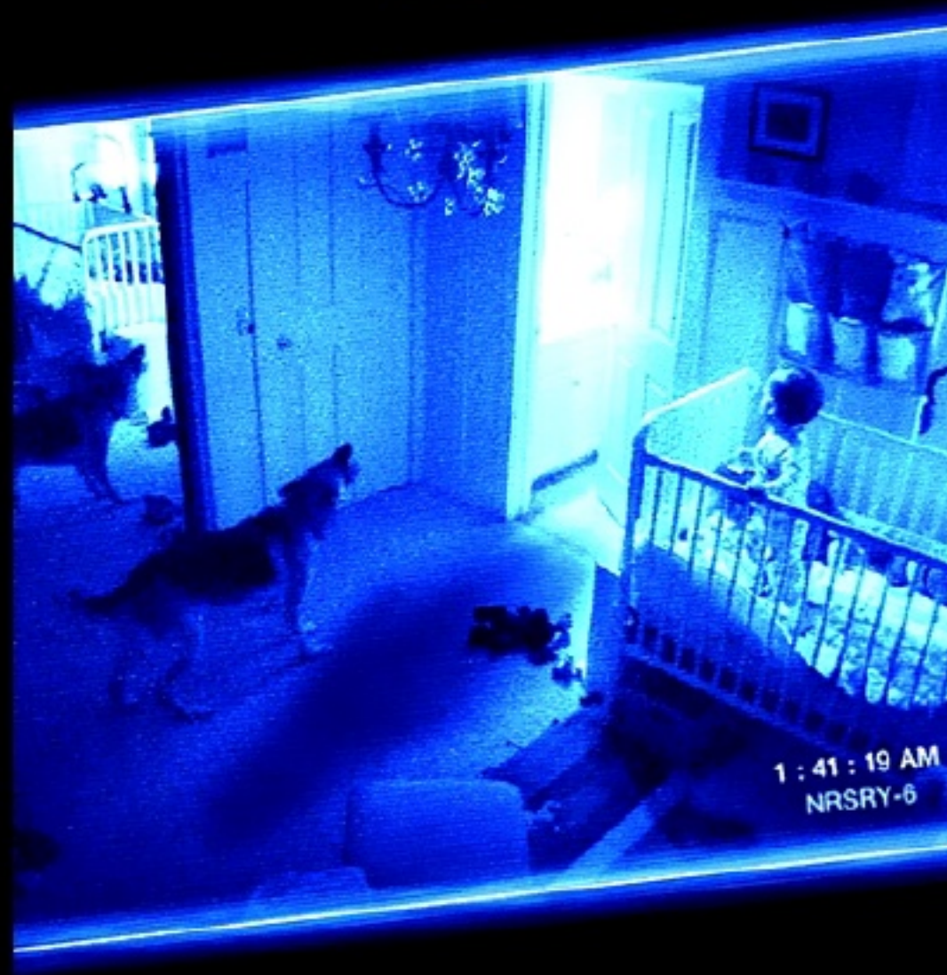
Paranormal Activity 2 (Tod Williams, 2010)