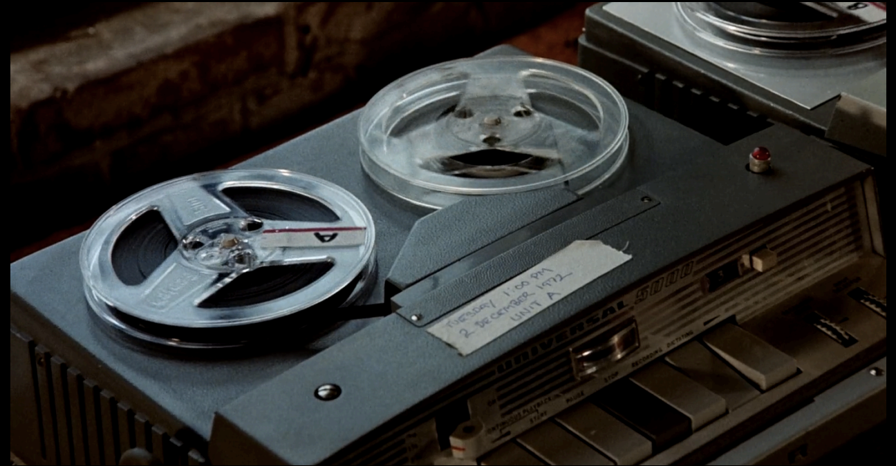
The Conversation (Francis Ford Coppola, 1974)