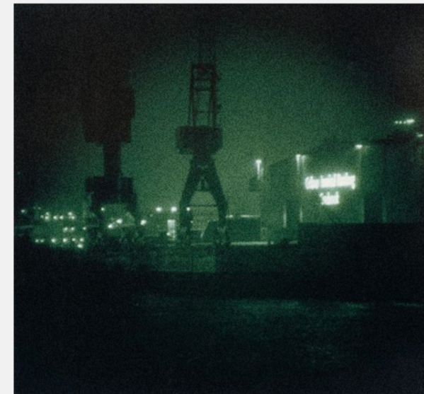
Thomas Ruff – Night 1, II » 1992