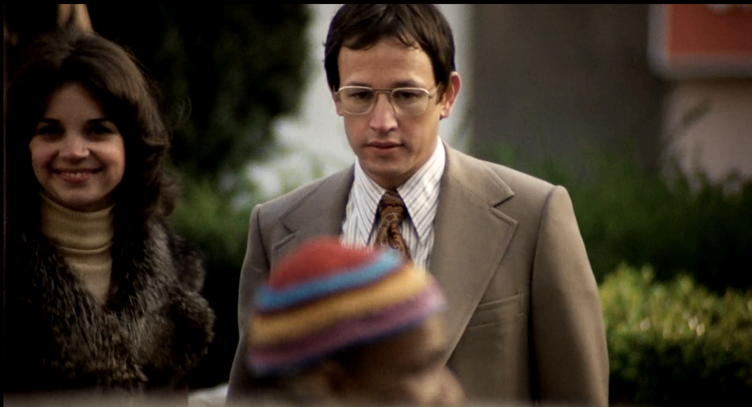
The Conversation (Francis Ford Coppola, 1974)