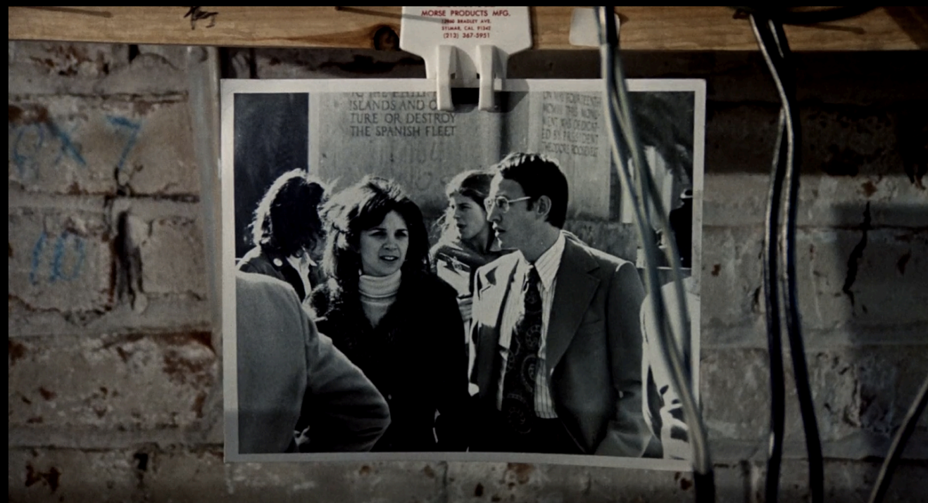
The Conversation (Francis Ford Coppola, 1974)