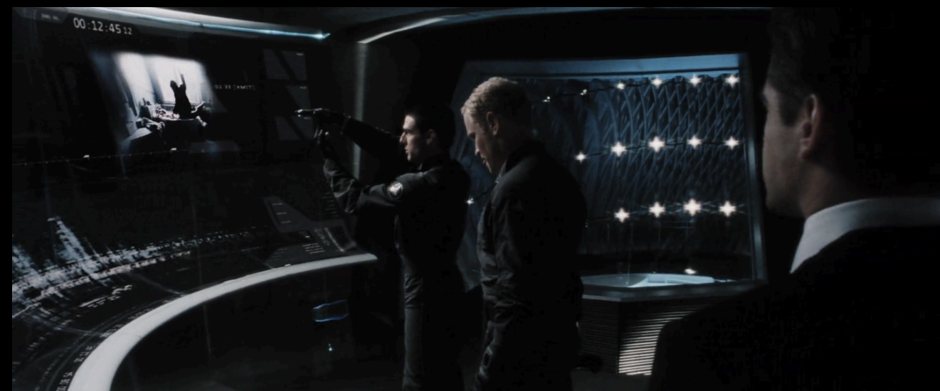
Minority Report (Steven Spielberg, 2002)