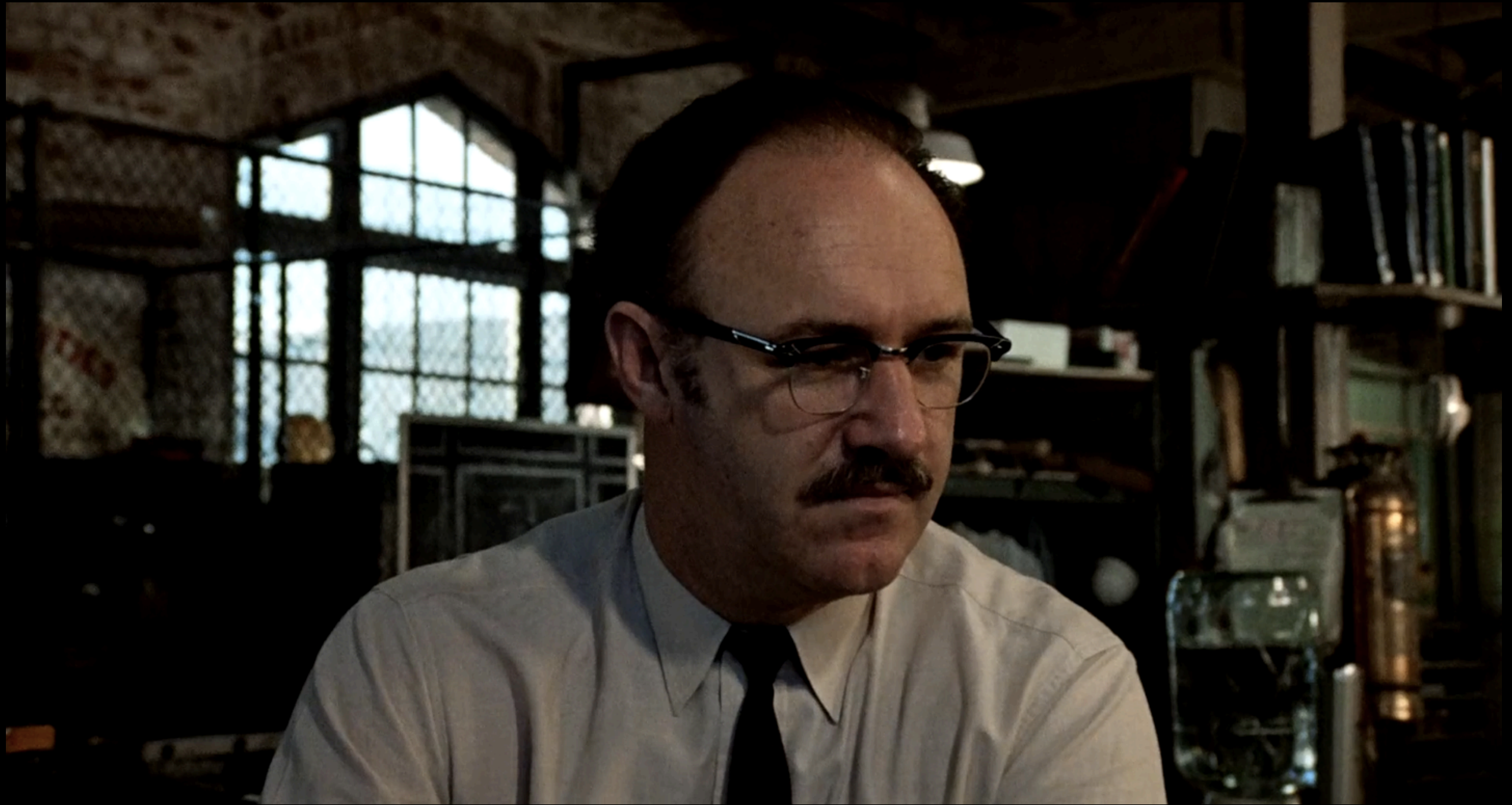
The Conversation (Francis Ford Coppola, 1974)