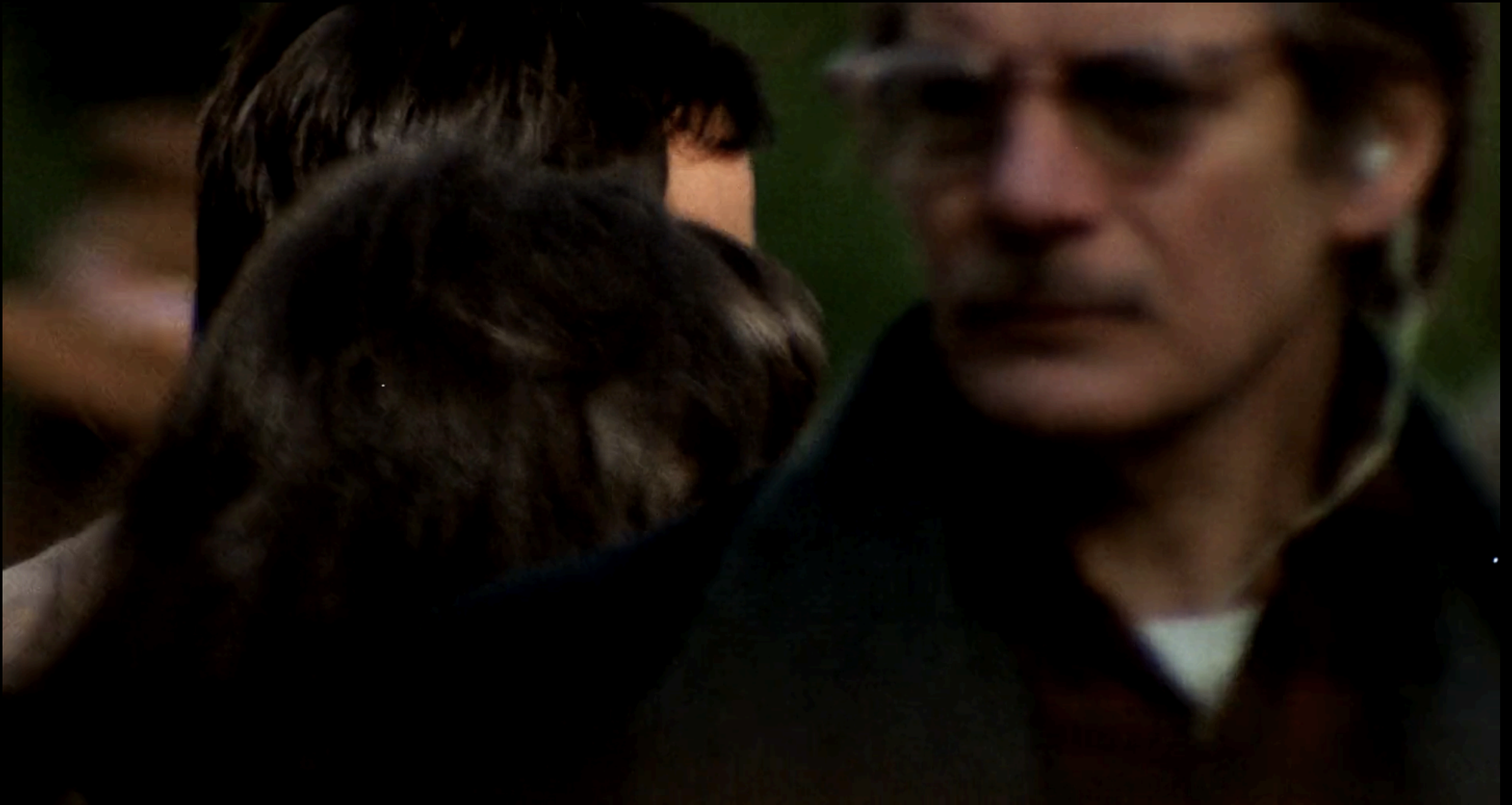
The Conversation (Francis Ford Coppola, 1974)