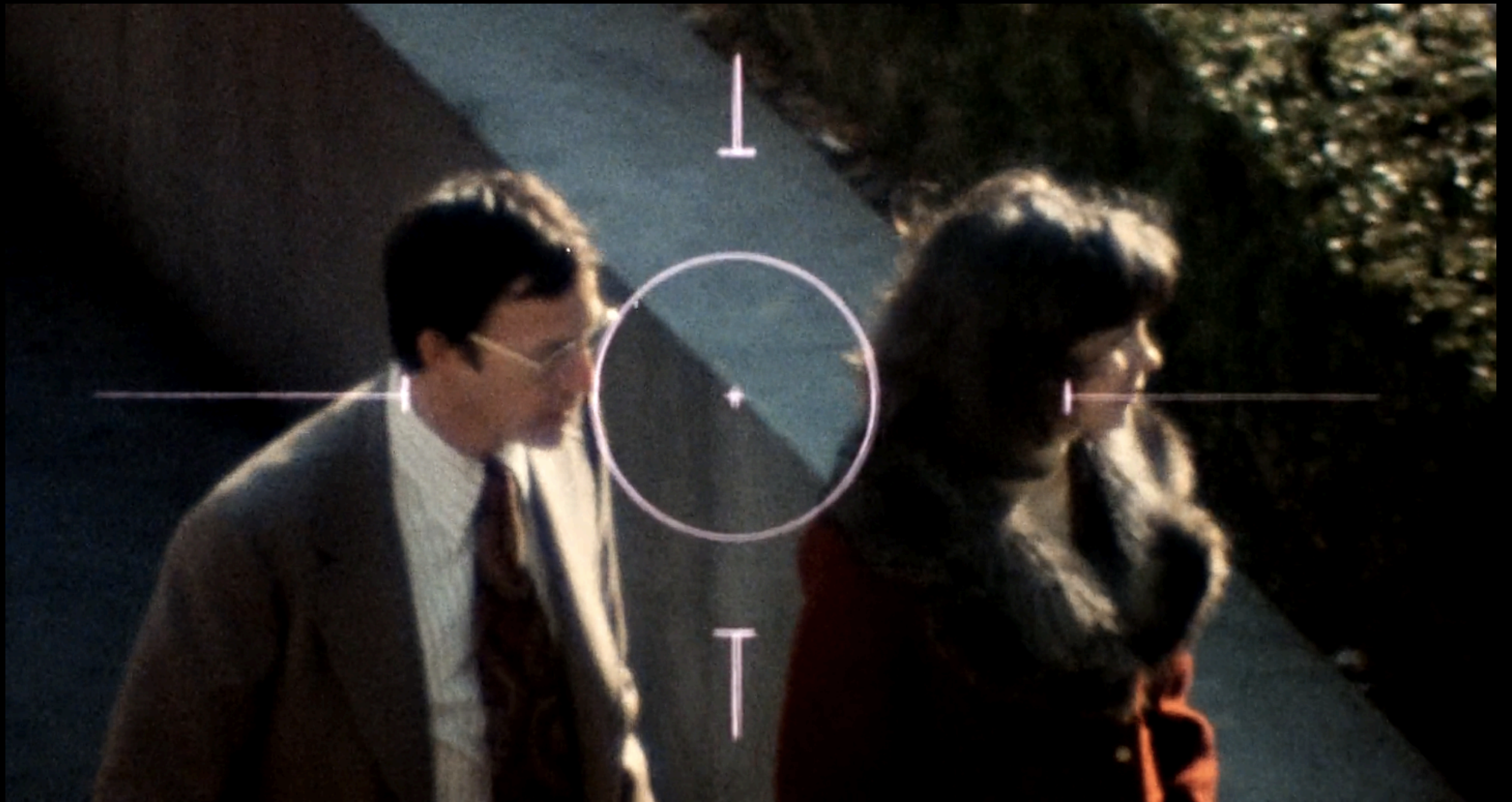
The Conversation (Francis Ford Coppola, 1974)