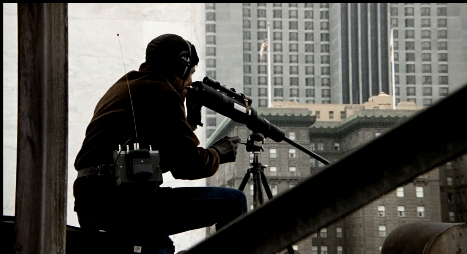
The Conversation (Francis Ford Coppola, 1974)