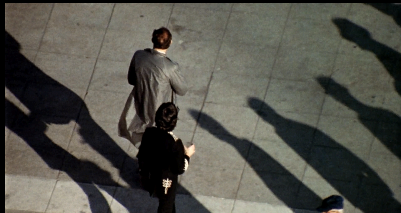
The Conversation (Francis Ford Coppola, 1974)