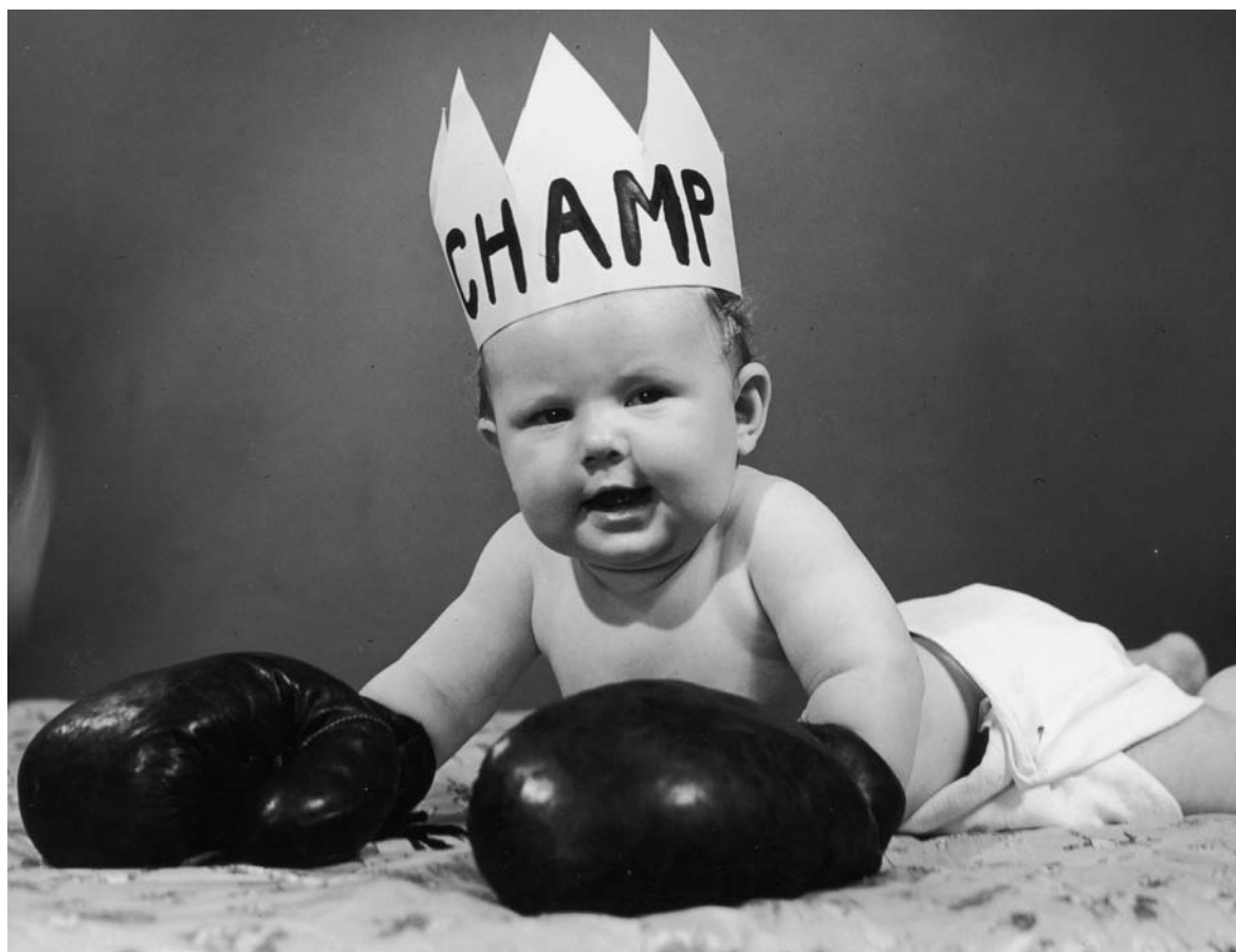
Les enfants rois ne sont pas si rois que cela.

Pourquoi ? Ou'est-ce qui amène certains parents à se mettre au service de ce petit suzerain ? Quelles sont les motivations des parents à laisser s'instaurer ces situations inversées, où c'est l'enfant qui fait la loi ? Où l'adulte est un enfant démuni, sans moyens d'intervention, face à cet être tellement plus petit que lui, tellement dépendant, et qui cependant devient un géant au pouvoir sans bornes, devant lequel il se plie ? L'hypothèse que je développe, c'est que les adultes sont dans une profonde identification à Sa Majesté le Bébé, à qui ils autorisent, par procuration