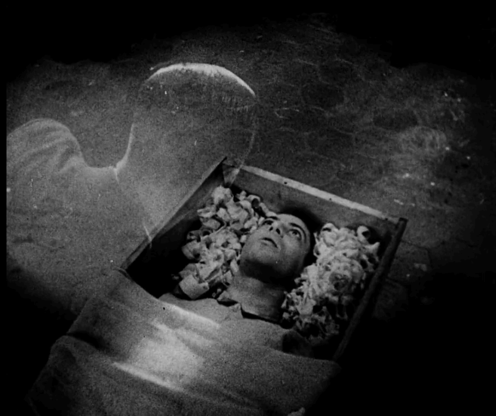
Vampyr , Carl Theodor Dreyer (1932)