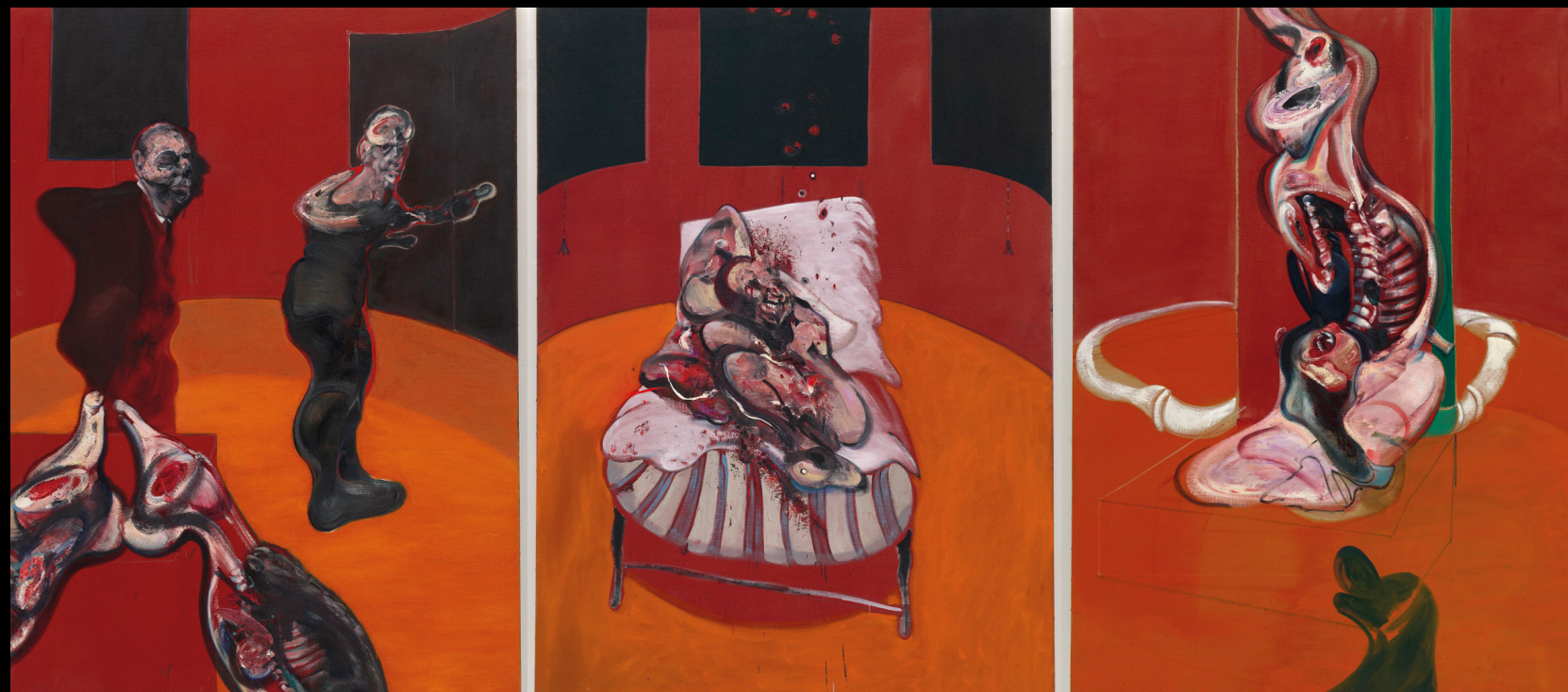
Francis Bacon, Trois études pour une crucifixion (1962)

C'est sûr, nous sommes de la viande, nous sommes des carcasses en puissance. Si je vais chez un boucher, je trouve surprenant de ne pas être là, à la place de l'animal. Mais traiter de cette façon particulière la viande est peut-être comme la façon dont on pourrait traiter la colonne vertébrale, puisque nous voyons tout le temps des images du corps humain dans des radiographies et que cela change manifestement les façons dont on peut traiter le corps.