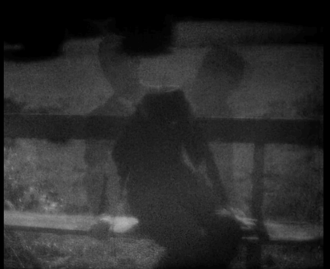
Vampyr , Carl Theodor Dreyer (1932)