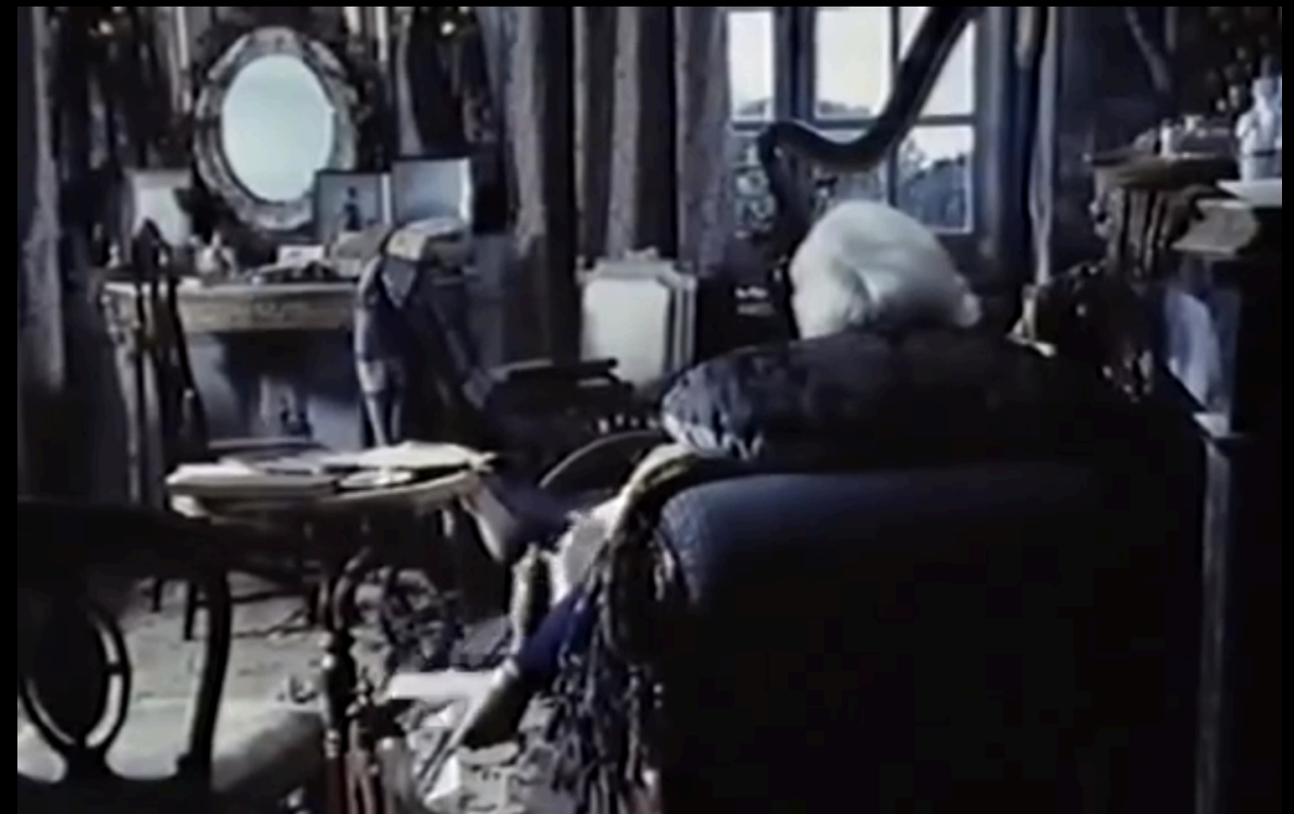
La Chasse aux papillons , Otar Iosseliani (1992)