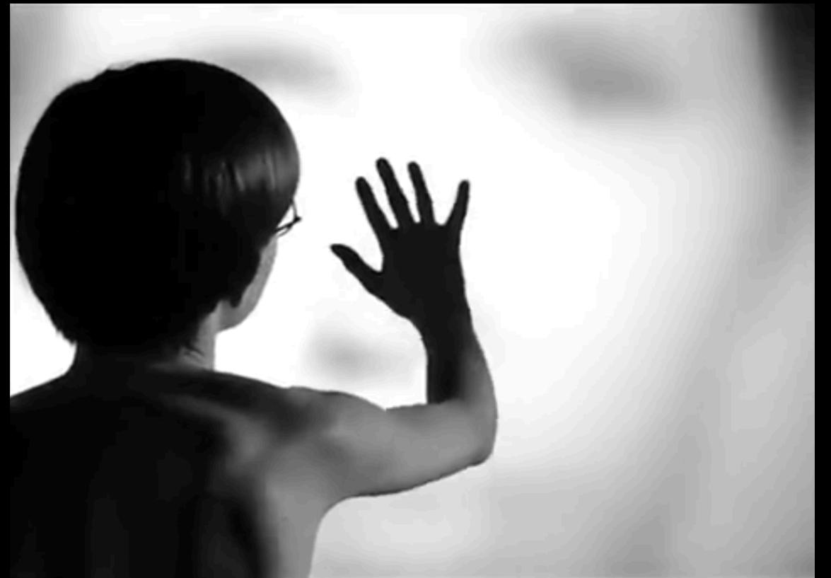
Persona (Ingmar Bergman, 1966)