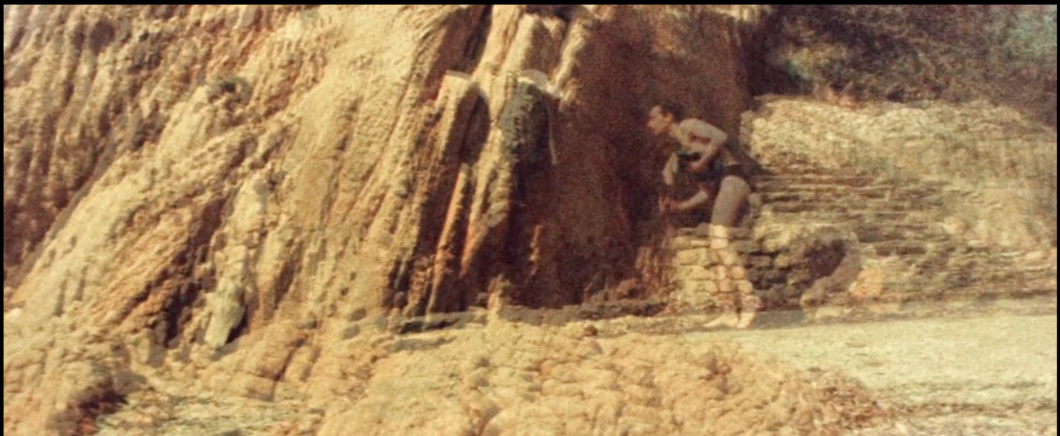
Louise Bernard Pallas, Les Joues froides (2021)